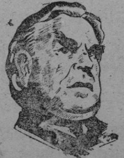
John L. Lewis

Washington, 4. - El Presidente del Sindicato de Mineros, John L. Lewis, ha rechazado las proposiciones de paz del Presidente Truman sobre la cuestión de los mineros del carbón y ha señalado que es dudoso que el Gobierno pueda tomar alguna medida para obligar a los mineros a volver al trabajo. - Efe.