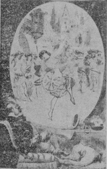
El teatro a domicilio por medio del "tele-noscopio" según grabado de 1883

La televisión (que llama tele-noscopio). Los concursos de belleza en traje de baño (exactos a los de las playas norteamericanas). La aeronavegación. Las millonarias. El transporte de viajeros por subterráneos. Los rascacielos.