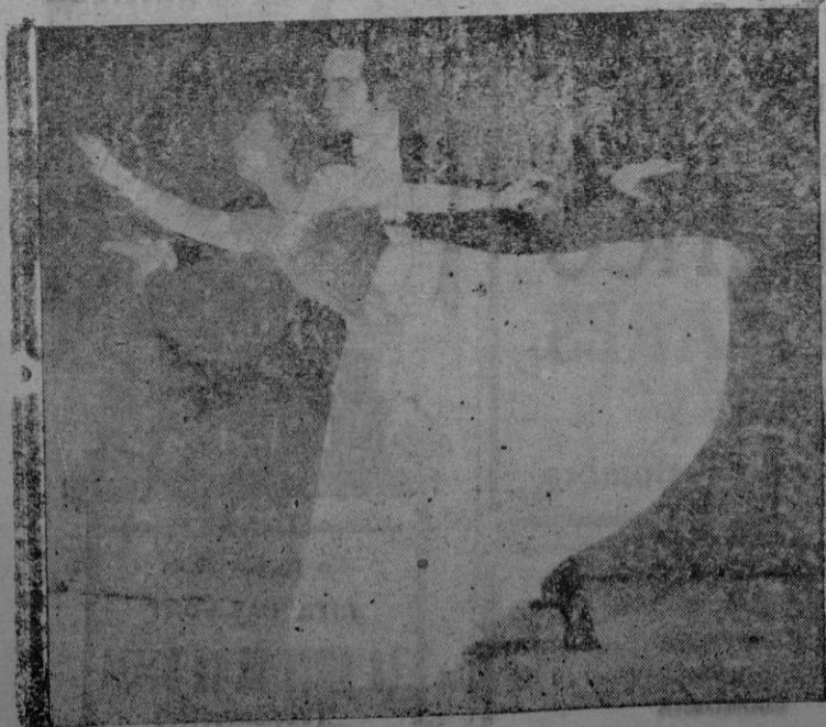
Un momento de la formidable actuación de la eximia pareja internacional de baile "RAUL y ELENA", que tantos éxitos obtiene en los magníficos jardines de "OLIMPIA"