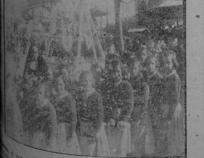
El popular vendedor "L'Havana" conversa con una niña mientras nuestro compañero Calet muestra con el índice algunas de las complicadas horizontales futbolísticas. — Abajo: un grupo de niñas asiladas, recorriendo las atracciones.