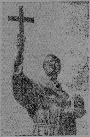
Estátua de Fray Junípero Serra en California

A medida que transcurre el tiempo más se agranda la figura del misionero mallorquín Fray Junípero Serra. La obra titánica llevada por él a cabo en tierras de América, cobra vida y relieve en el correr de los años. No podía ocurrir de otra manera siendo como es Junípero Serra uno de los que despertaron el continente americano y lo lanzaron por los caminos de la civilización. Esto es en sí estimable y de una gran trascendencia. Hacer posible el que la selva deje sus rudimentarias maneras para incorporarse a los modos del mundo civilizado, es obra altamente digna y admirable. Máxime, cuando al despertar material de los pueblos se une el despertar espiritual encarnado en las verdades de nuestra sacrosanta religión.