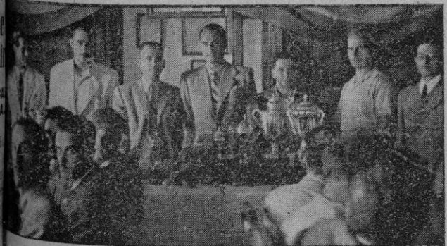
Presidencia del acto de entrega de premios celebrado en la sociedad "La Paloma"