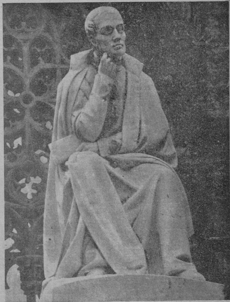
Estatua de Jaime Balmes, que preside el claustro de la Catedral de Vich, su ciudad natal, en la que hoy se conmemora solemnemente el centenario de la muerte del insigne filósofo