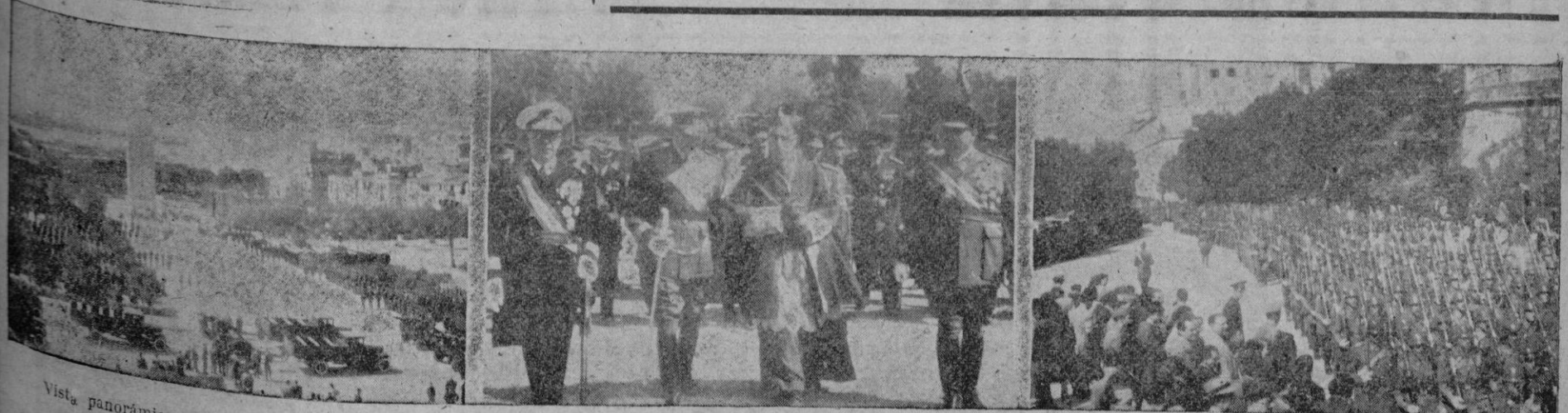
Vista panorámica de la plaza Héroes del Balears durante la misa de campaña; las autoridades dirigiéndose a la tribuna para presenciar el desfile de las fuerzas y un aspecto del mismo durante la brillante fiesta militar celebrada ayer en conmemoración del Día de la Victoria

Roma. — "Con la falta de una normalidad diplomática entre España e Italia se perpetúa un absurdo étnico, lingüístico, económico y jurídico", dice en un artículo publicado por el "Giornale della Sera", el profesor de literaturas neolatinas de la Universidad de Cagliari. "Piénsase —añade— que Italia mantiene relaciones diplomáticas con países que de hecho han abdicado de toda soberanía; piénsase en la mentira convencional que nos hace reconocer Gobierno en donde la legalidad democrática ha sido por decirlo así socavada en favor de una gigantesca dictadura internacional, y si pensamos que Hungría, y Polonia, Rumania, Bohemia y Bulgaria han cambiado de estructura "de facto" y pateados y ahogados los imprescriptibles derechos, no se negará que falta toda base jurídica para el cerco diplomático que Moscú quiere imponer a Madrid".