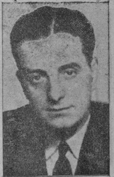
El representante republicano del Estado de Wisconsin, Alvin E. Okonsky, autor de la propuesta de inclusión de España en el Plan Marshall

Washington, 1. — En tercera y definitiva votación, la Cámara de Representantes ha aprobado el proyecto de ayuda global extranjera por valor de 205 millones de dólares por una votación de 329 votos contra 74, comprendiendo la