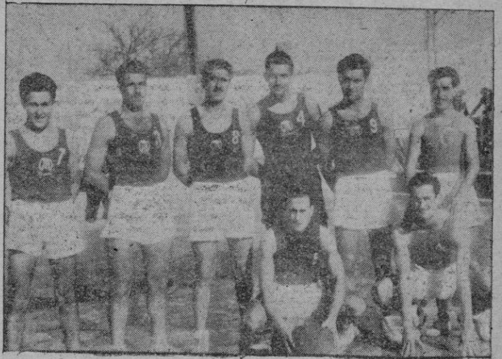
El Hispania, probable campeón de Baleares de baloncesto