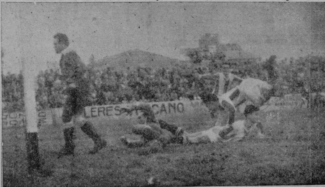
El primer tanto del Atlético-Baleares

El Igualada se impuso en los primeros 45 minutos gracias a su mejor juego, pero su dominio no pasó de la cerrada defensa que formaron Amengual y Llompart y si alguna vez consiguieron salvarla los peninsulares, se encajaron después con un Diego