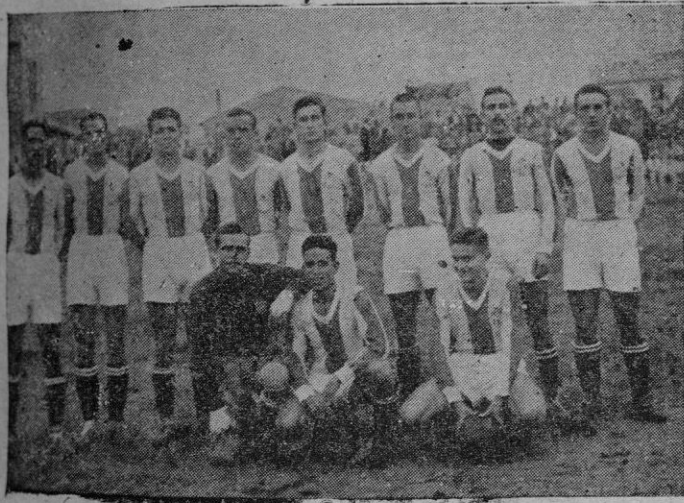
El equipo del Atl.-Baleares, que venció por dos goles a cero al Igualada