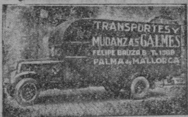
Felipe Bauzá, 8. - Teléfono 1388