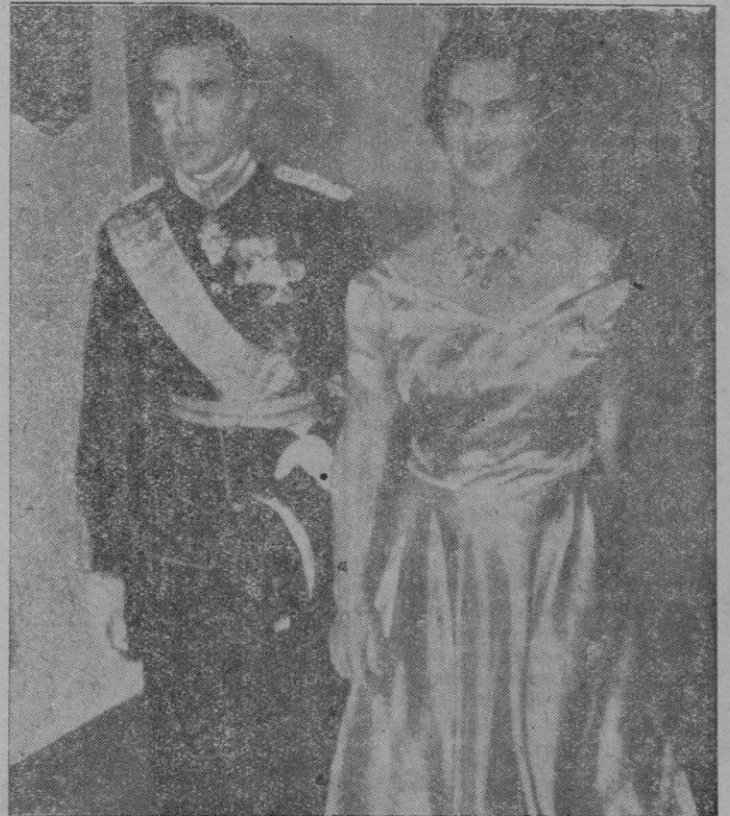
El príncipe Gustavo Adolfo de Suecia, primogénito del heredero del Trono, que pereció en accidente de aviación. Le acompaña su esposa la princesa Sibila de Sajonia

Copenhague, 30.— Los restos mortales del Príncipe Gustavo Adolfo fueron trasladados a bordo del crucero sueco "Oscar", que zarpó rumbo a Suecia a las nueve de la mañana.