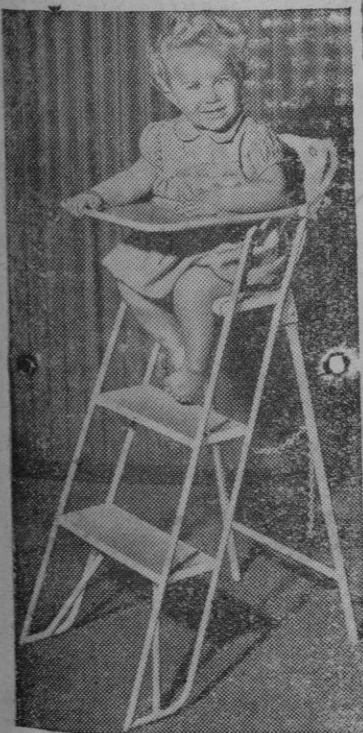
En la Gran Bretaña han aparecido unos muebles muy prácticos para las casas de habitaciones reducidas. En la fotografía vemos una silla para un baby, que puede ser convertida en una tabla de planchar