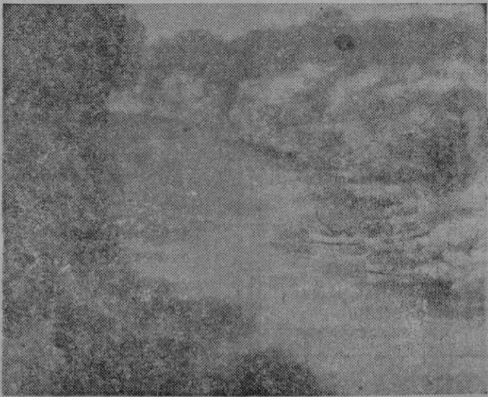
Uno de los cuadros de Alzubide, que figuran en su exposición de "Círculo de Bellas Artes"

Te digo un cantar español: "El amigo verdadero -- ha de ser como la sangre -- que acude siempre a la herida -- sin esperar que la llamen". Nos trajisteis amor y ayuda valiosa; os devolvemos amor y gratitud. Te ruego, Malatesta querido, que hagas presente al general Perón mi saludo más reverente y un abrazo paternal desde el puesto que ocupo en el Ejército español. Buen viaje para tí, para tus oficiales, para tus muchachos, para tus marinos. Te abraza: Millán Astray". -- Cifra.