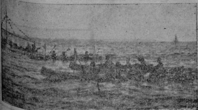
Los piragüistas que hicieron la travesía Alicante-Palma al entrar en nuestro puerto