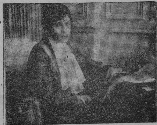
La famosa tiple María Barrientos que ha fallecido en Francia