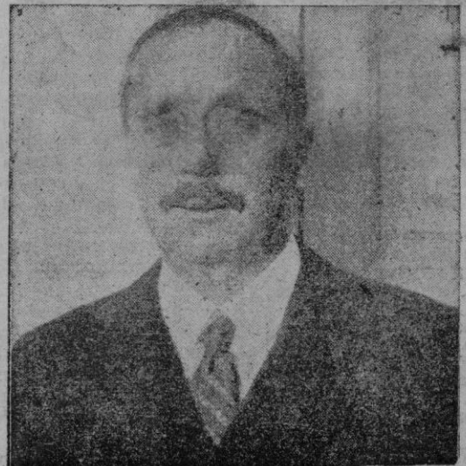
Mr. G. Wells, el célebre novelista inglés que acaba de fallecer

Los «Negros moderados» tienen mayoría en la Asamblea e hicieron su campaña electoral con los lemas: «El poder para los negros» y «Mueran los mulatos».