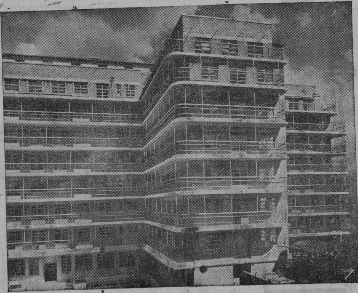
He aquí reflejado uno de los magníficos ejemplos de la arquitectura británica de la post-guerra. El edificio en cuestión pertenece a un gran Hospital de niños situado en Londres

El desarrollo de los acontecimientos ha demostrado la autenticidad del informe de Kravchenko. Apenas había terminado la guerra cuando la Rusia soviética volvió a su táctica, la furia reapareció suelta en sus formas más críticas de acuerdo de Yalta: los sucesos de Irán, los ultrajes comunistas en Manchuria, la revuelta de los kurdos en el Irán, los enormes ejércitos en Bulgaria, la reaparición de la tercera internacional en todos los países, los ataques a Manchuria en Oriente, la intimidación de Francia, el bolchevismo de Tito en Yugoslavia y Beirut y en Polonia