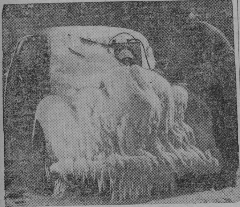
Un coche recién fabricado pasa por la prueba de "cero grados" que consiste en someterlo a bajas temperaturas durante tres días para poner a prueba todos los instrumentos eléctricos y aparatos de control del coche, antes de comenzar la exportación en serie.

A partir del próximo día los poseedores de tarjetas de aprovisionamiento de gasolina solicitarán podrán recibir cupos extraordinarios, sin limitación de cantidad con un mínimo de litros. — Cifra.