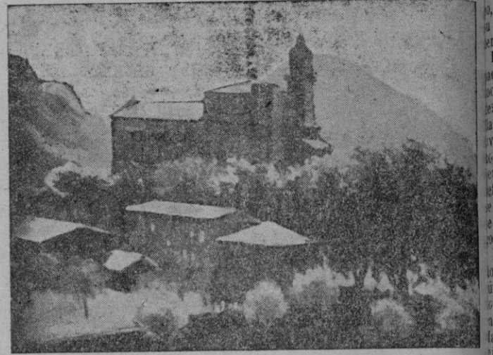
La Cartuja (Valldemosa), óleo de Pedro Sureda