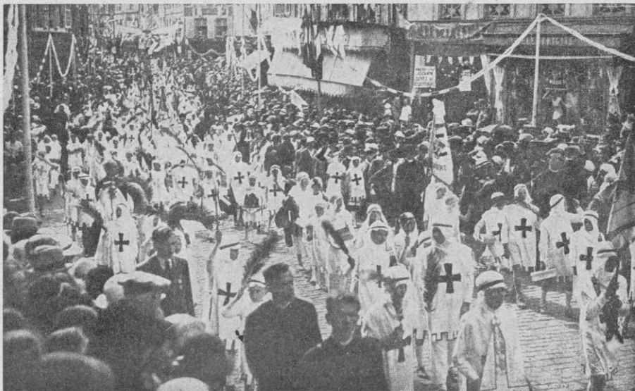
La procesión infantil del Congreso de Liesse