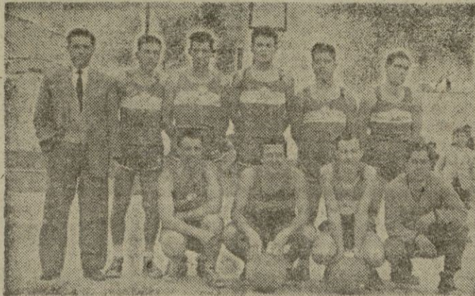
Equipo del Patronato