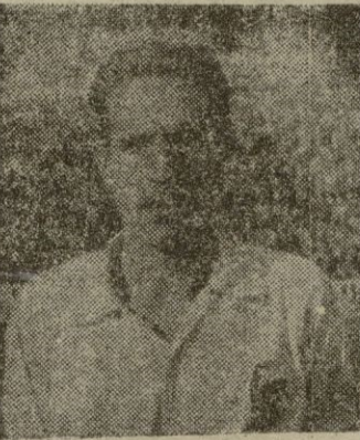
GERMÁN El defensa máximo goleador del Campeonato

Esta semana no se han producido muchos cambios en esta clasificación que tanto apasiona y en la cual se disputan los