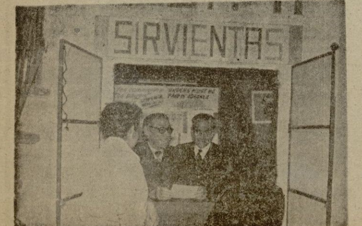
Una de las agencias de colocación de sirvientas.

—¡Naturalmente! Después de dar los detalles que les piden, se van juntas. Se presenta otra, bien trajada y un tanto pintada. Dirigiéndose al agente, dice: