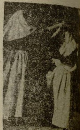
¡Ideal de muchas no heces. ¡Arriba España!

Pero en los ojos de las camaradas rezoza un brillo que habla. Es la enorme alegría que por fin cristaliza en un