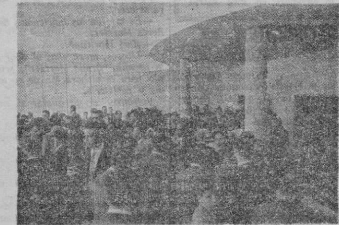
Autoridades, representantes, los directores de la fábrica y propietarios ya de estas 22 unidades «Biscuter-Voisin», que fueron bendecidas el domingo, y varios centenares de invitados, en el momento de la inauguración de los locales BISCUTER-VOISIN, de la calle de Reina Esclaramunda