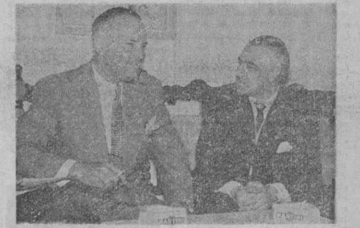
El Embajador de los Estados Unidos en España conversa con nuestro Director a lo largo de la entrevista que tuvo a bien celebrar ayer con los periodistas palmesanos.

Al Embajador le gusta llenar su charla con palabras españolas. Preferentemente, sus exclamaciones —¡Oh, sí mucho!, dice cuando oye una afirmación admirativa. Le preocupa poder hablar lo antes posible en español. —Hablo francés e italiano y es-