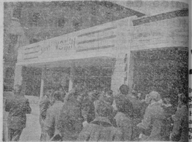
Un aspecto de la fachada principal del local de Reina Esclaramunda se ha establecido la exposición y venta de esta maravilla técnica, de total fabricación española 31 «Biscuter-Voisin»

de más acusado relieve. En él han paseado su Majestad el Rey Alfonso XIII, el infante don Jaime, el General Primo de Rivera, etc... Y detrás seguían las plateadas estampas de los 22 primeros BISCUTERS que rodaban por Palma, atrayendo las miradas de todos los transeúntes. Y el contraste que se