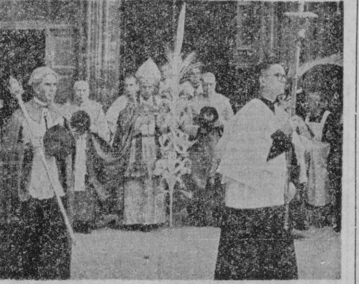
La solemne procesión de las Palmas, presidida por el Excmo. y Rvdmo. Sr. Obispo de Mallorca