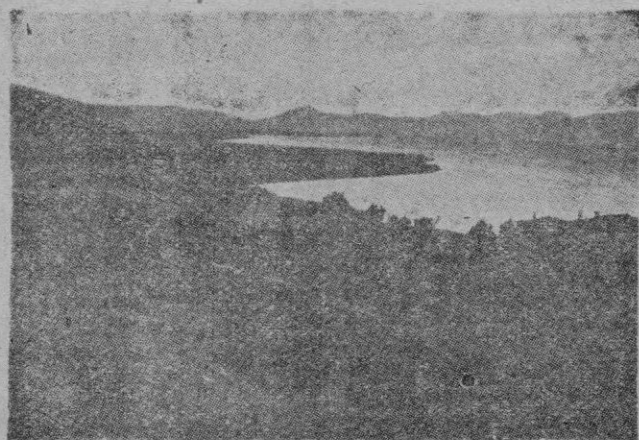
Vista de una isla griega en el Mar Jónico

La Unión Griega de Genios de las Letras pretende erigir allí un templo al pensamiento y a las letras.