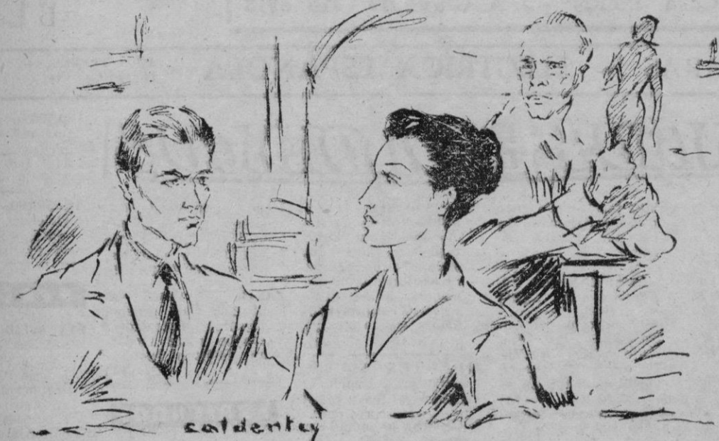
Marina Joyce era tan perfecta, que parecía haber reunido todos los encantos que caben en una mujer.

—¿Por favor! — suplicó uno de los presentes. ¿No nos tenga más sobre áscuas y complétenos el relato de Moore! —Lo haré con mucho gusto — dijo el lord-detective. Pero han de prometerme ustedes guardar el secreto. De no ser así me pondrían en un gran compromiso. Todos hicieron protestas de no decir nada y lord Marlinghue comenzó su relato.