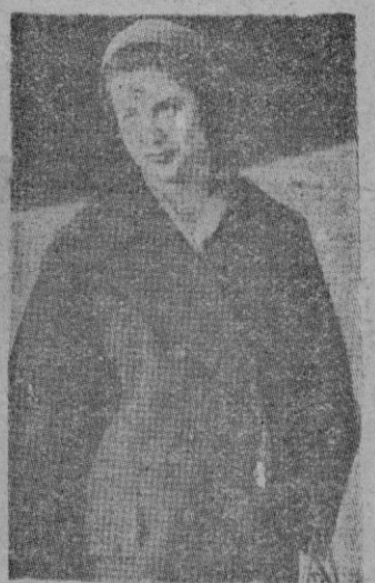
Se casó María Pía de Saboya

Por la noche en la Catedral se celebró un acto Eucarístico y se leyó un Te-Deum pronunciando el Obispo preconi-