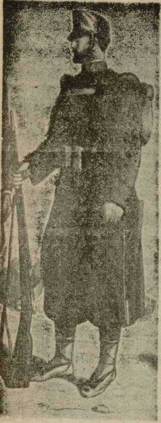
El arquetípico soldado de Infantería española, personalizado en el de la campaña de África de principios de siglo.

No está, sin embargo, muy definido el origen y el motivo por el que la Infantería española escogió a la Purísima Virgen como Excelsa Patrona, si bien, como veremos más adelante, la devoción de los españoles a la Madre de Jesucristo es tan antigua casi como la propia historia de la Hispanidad.