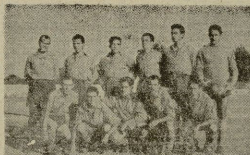
El magnífico conjunto del Soledad, hoy en cabeza de la competición en I Categoría Regional, que se enfrentará esta tarde al Felanitx en partido de gran compromiso.