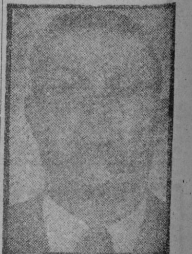
La foto reconstruida por la Policía.