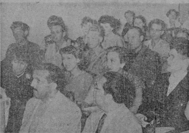
Empezaron los Cursos de Verano para Extranjeros en el Estudio General Luliano, en combinación con la Universidad de Barcelona. Vean estos rostros puramente anglosajones en un momento de la inauguración