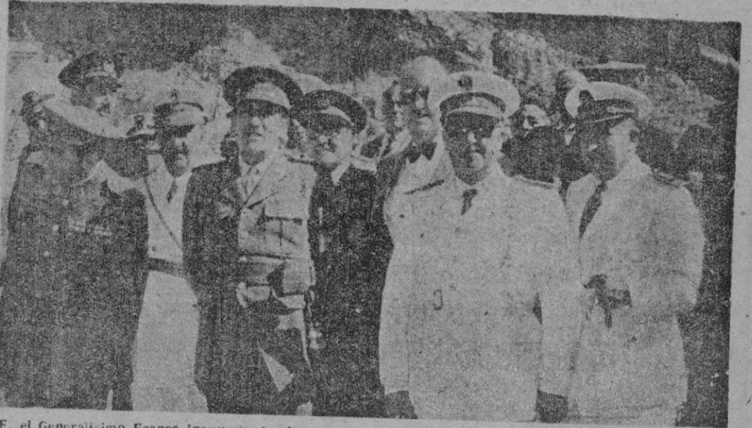
S. E. el Generalísimo Franco inaugurando el pantano de El Vado, decisivo para el suministro de agua a Madrid. Acompañan al Caudillo los Ministros de Obras Públicas y del Ejército, así como otras personalidades. El mismo día Franco inauguró el pantano de Palmares, con destino a riegos.