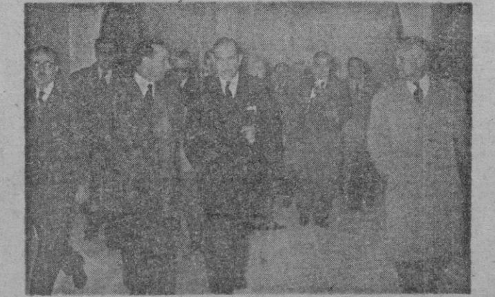
El Excmo. Sr. Gobernador Civil en su visita a la Escuela de Formación Profesional "Virgen de Lluch", acompañado del Delegado Provincial y otras personalidades