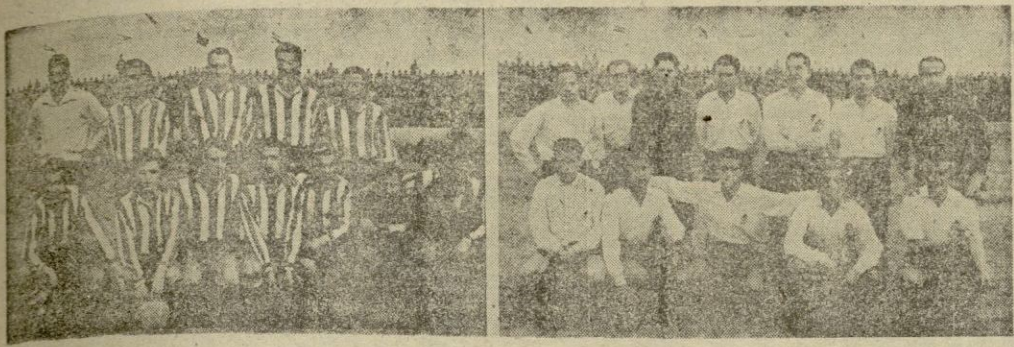
Los equipos del "Manacor" y del "Constancia" po an para BALEARES, antes de iniciarse el partido que terminó con una victoria favorable a los propietarios de "Na Capellera"