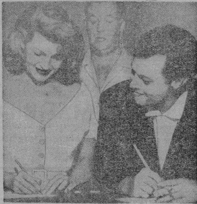
Los casos como el de la famosa Rita, casada y divorciada varias veces, no son frecuentes en Norteamérica.

Ese hogar medio norteamericano confortable, pulcro y hasta elegante que tantas veces vemos en películas y en revistas ilustradas es, en la mayoría de los casos, el resultado de una continua labor de cooperación por parte de todos los miembros de la familia. Ya es sabido que en Norteamérica el servicio doméstico ha dejado prácticamente de existir. Es el ama de casa la que tiene que hacer las faenas domésticas; cierto que dispone de aparatos eléctricos que facilitan y