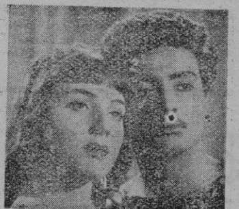
Una escena de la película con la pareja protagonista.

Desde siempre el cine italiano se ha dado maña especial para organizar, con aparato fastuoso, el film histórico. Este es histórico hasta cierto punto. Cuando hay que retrotraer la acción a dos mil años, los guionistas, o son muy oscuros y pomáticos, o, por las buenas, se entregan en manos de la fantasía, la extravagancia y la audacia.