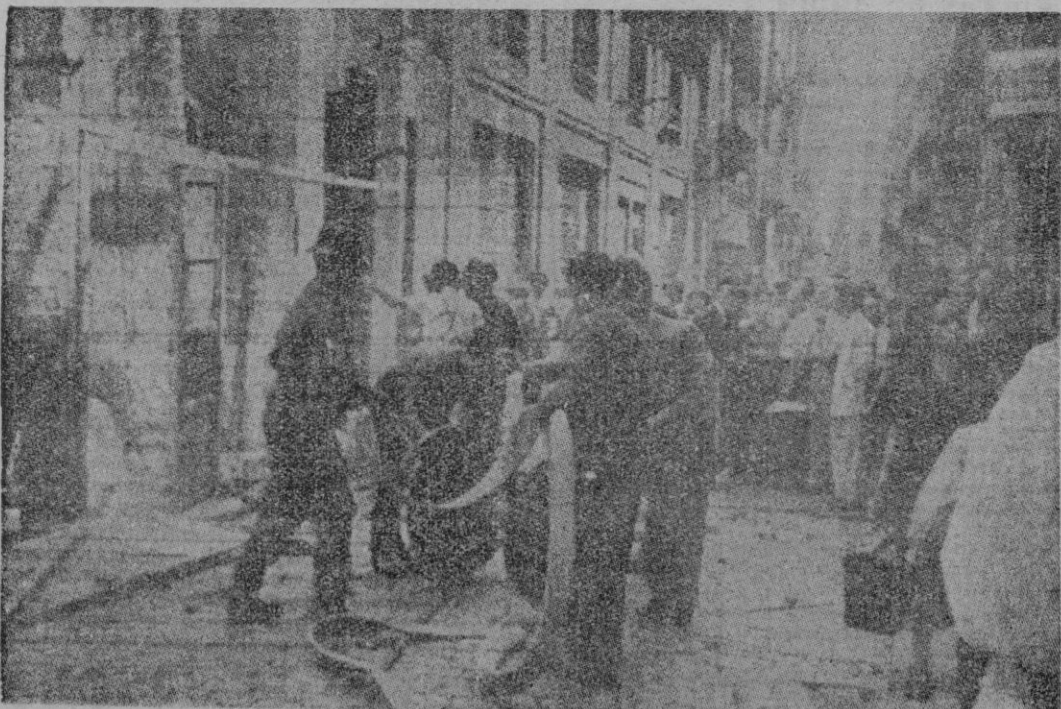
Barcelona.—Los bomberos proceden a situar las mangueras para la extinción del incendio ocurrido anteayer en las obras contiguas a «La Vanguardia»