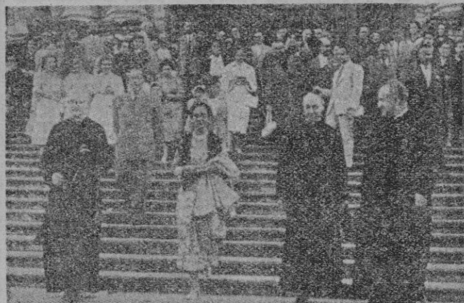
S. E. la señora doña Carmen Polo de Franco, a la salida de la visita que efectuó a la basílica de Loyola