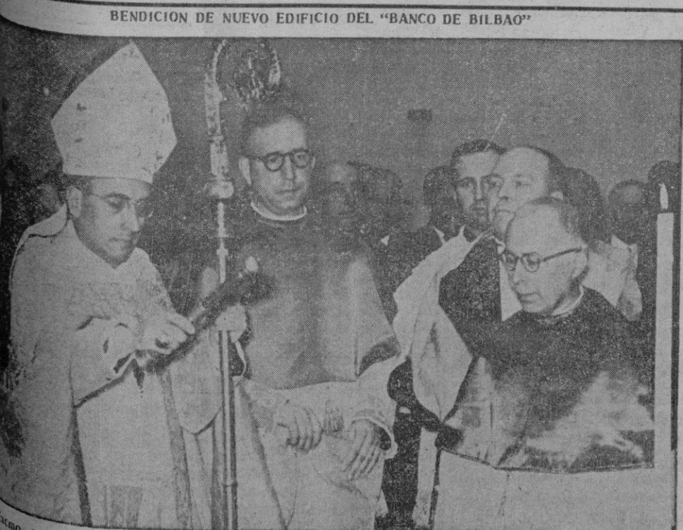
BENDICIÓN DE NUEVO EDIFICIO DEL "BANCO DE BILBAO"

Se calcula que un millón de espectadores presenciaron la revista naval.