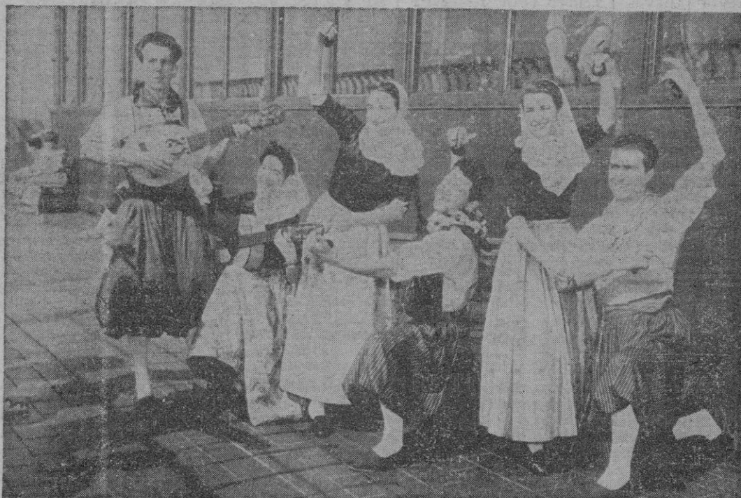
NEUA YORK.—Muchachos y muchachas de Baleares de los Coros y Danzas de España, que realizan una jira artística por Norteamérica, bailan en el edificio más alto del Mundo, el Empire State, de 1472 pies de altura.