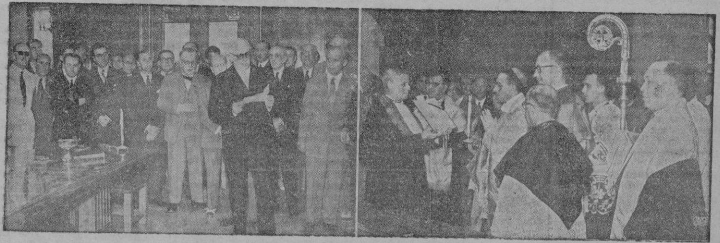
Los momentos de la inauguración y bendición del nuevo Banco.