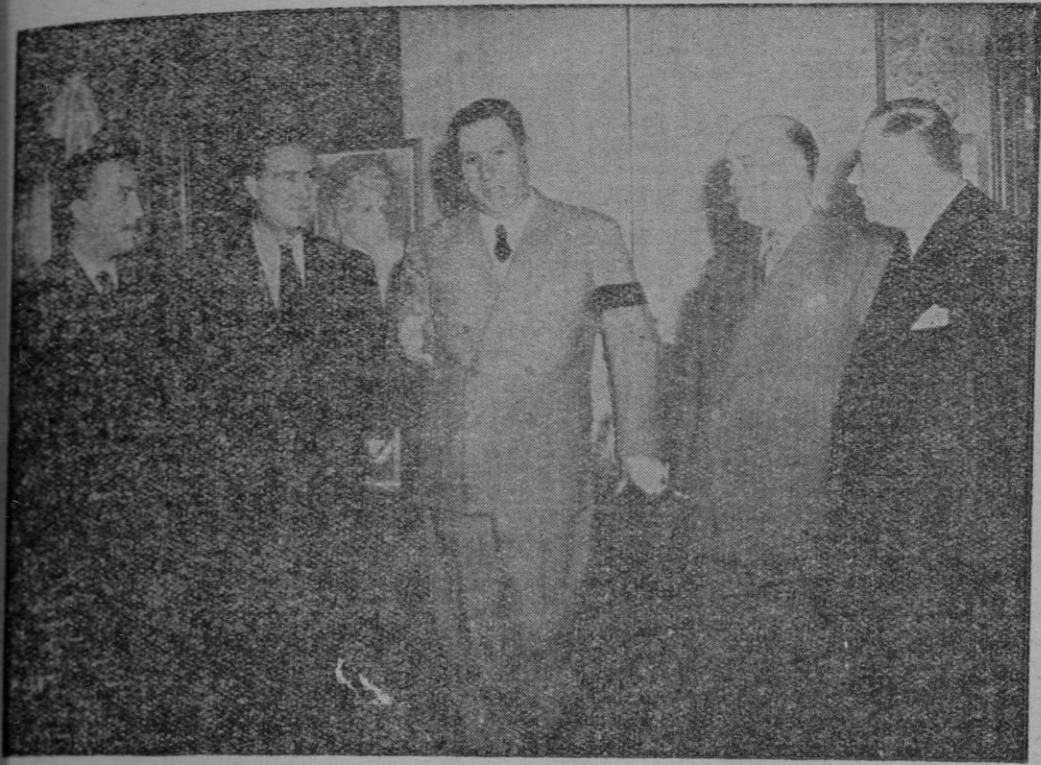
BUENOS AIRES.—El general Perón, acompañado por el Ministro de Trabajo y Previsión, señor Alejandro Giavarini, recibió a la delegación de sindicalistas españoles, que realiza una visita por toda la América Latina. Los españoles fueron portadores de un saludo de los trabajadores de España para el general Perón y le entregaron un distintivo de la Organización Sindical Hispana.