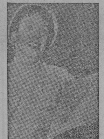
seguido la ciudadanía norteamericana. Hela aquí en la ciudad de Los Angeles mostrando su documento de "nacimiento" yanqui

LA famosa estrella de la pantalla Hedy Lamarr, nacida en Austria, o quizá en Checoslovaquia — es cuestión de edad — ha con-