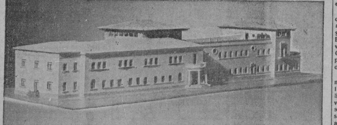
AYER se celebró el acto de la colocación de la primera piedra del nuevo Instituto de Maternología, del que ofrecemos esta bella visión de lo que será el edificio. (En el interior, amplia información del acto celebrado ayer)