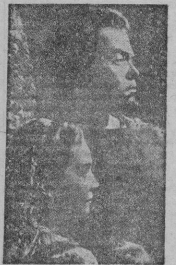
Orson Welles y Suzanne Cloutier en una escena

Nacionalidad: Americana. Proyección: Rialto, Augusta y Moderno. La prueba, insoslayable, de la emoción que ha puesto Orson Welles