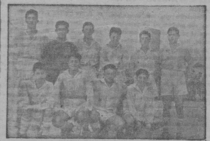
El once del La Salle de Manacor que fué vencido por el España en Lluçmanor.

Arbitró Simó estupendamente, siendo al final felicitado por ambos equipos. Del Porreras, todos estuvieron muy bien y del Constancia, el mejor Company.