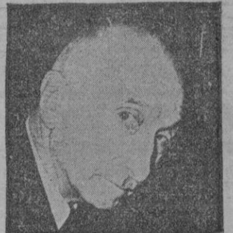
MAURIC, el Nobel de Literatura 1952.

Reciben sus premios de manos del Rey Gustavo