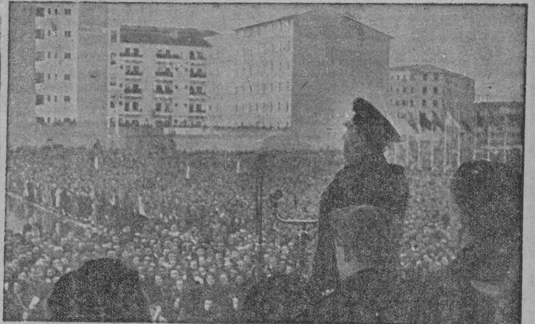
PAMPLONA. — S. E. el Jefe del Estado dirige la palabra a los ante él concentrados en la explanada donde se levanta el monumento a los Caídos.

NACIONALES EXTREMISTAS? París, 8. — En fuentes gubernamentales francesas se cree que los disturbios en el Marruecos francés han sido provocados por los nacionalistas extremistas para coincidir con el debate en la ONU sobre el Norte de Africa francesa.—Efe.