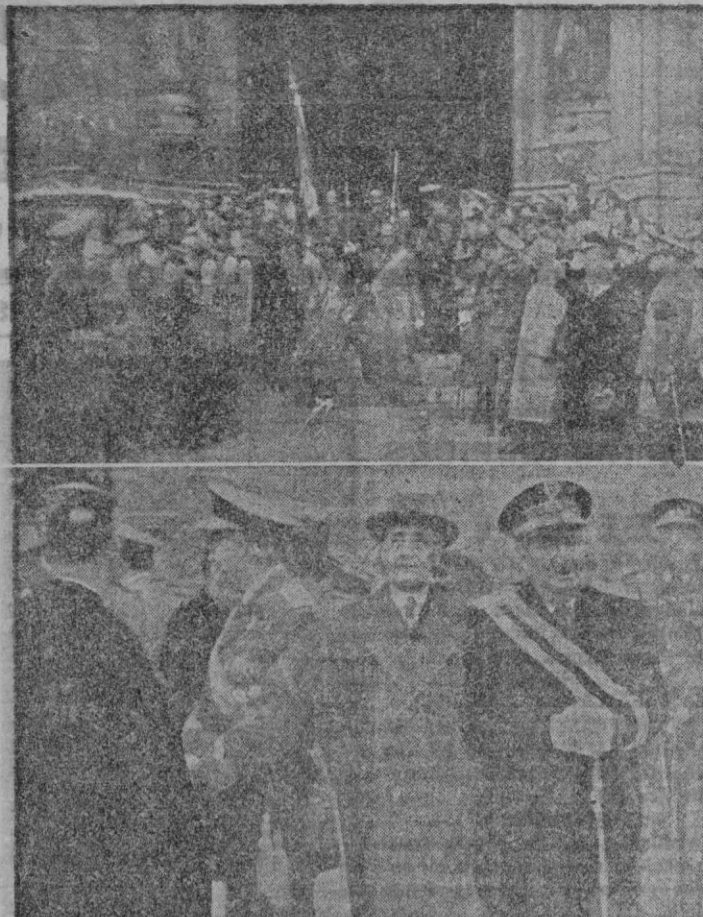
La gloriosa enseña de la Patria, a la salida de la Misa celebrada en la Basílica de San Francisco. — El Excmo. Sr. Capitán General de Baleares, con las demás autoridades que asistieron a la Misa de la Patrona de la Infantería. — (Foto "Juanet")