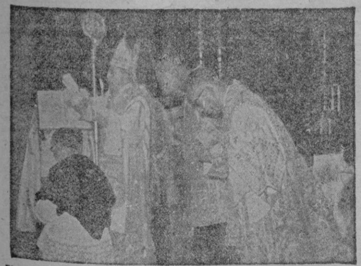
El Excmo. Sr. Obispo de Mallorca, Doctor Hervás Benet, en el momento de impartir la bendición con motivo del solemne Pontifical celebrado en la Santa Iglesia Catedral Basílica.