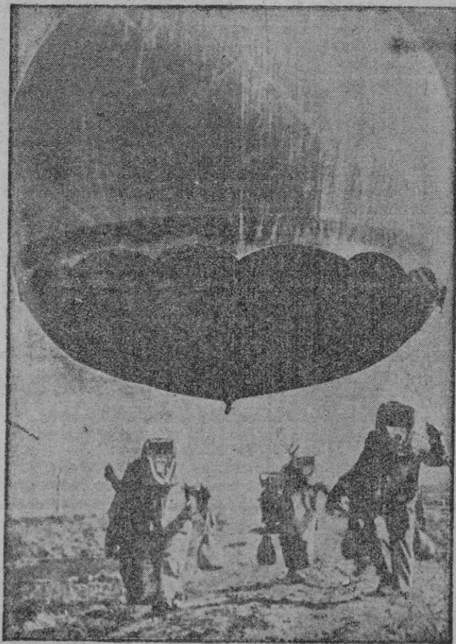
¡TODAVIA, no. Estos son soldados de las Naciones Unidas que en Corea llevan estos extraños trajes de asbesto, que les da aspecto de marcianos, y que son empleados actualmente en Corea para disminuir el peligro de incendio por el gas helio, muy inflamable, utilizado en estos globos militares.