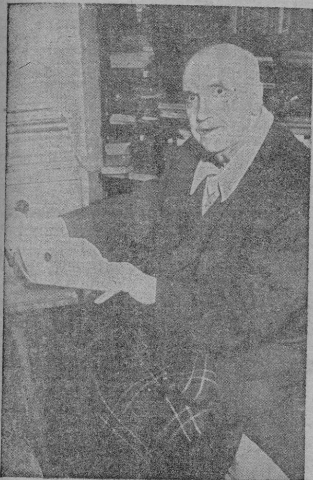
ROMA. — Esta es una reciente foto de Jorge Santayana, filósofo español, que acaba de fallecer en la celda que ocupaba en el Convento de las Monjas Azules de San Esteban, donde trabajó intensamente y escribió diversas obras.