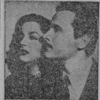
Una escena del film.

"Jugar con fuego", mejicana, es el colmo de lo redicho. En esa producción hay una entrega total al tópico, al melodrama, a lo cursi redicho, a lo sensiblero.