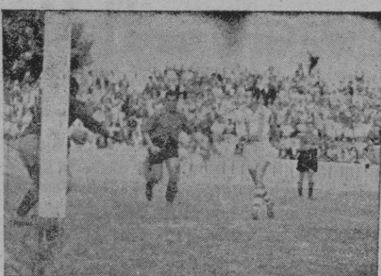
Tres intervenciones del meta murciano, deteniendo tres disparos de los delanteros locales.