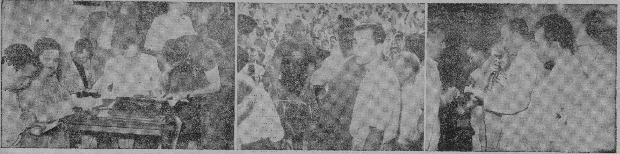
Ayer tarde tuvo lugar el precintaje de los corredores que hoy deben tomar la salida en la carrera organizada por BALEARES.