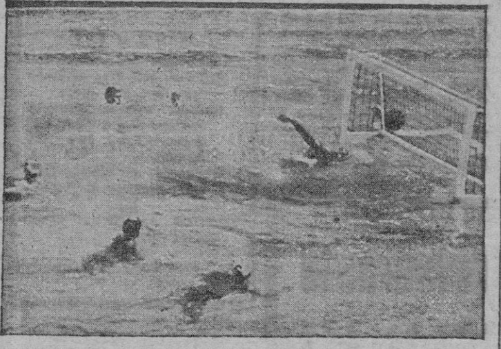
HELSINSKY. — HE AQUI UNO DE LOS GOLES MARCADOS POR EL EQUIPO ESPANOL EN EL ENCuentRO DE WATER-POLO CELEBRADO ENTRE ESPAÑA Y BRASIL Y QUE TERMINÓ CON LA VICTORIA DE ESPAÑA POR 6-4.