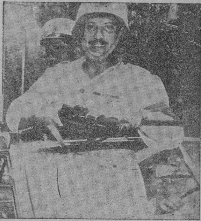
EL CAIRO. — EL GENERAL NAGUIB BEY — SENTADO, A LA IZQUIERDA — RECORRE LAS CALLES DE LA POBLACION BIEN GUARDADO POR ESTE OFICIAL DEL FUSIL AMETRALLADOR QUE MONTABA LA GUARDIA EN EL COCHE DEL GENERAL, MIENTRAS SE REALIZABAN LOS TRAMITES PARA LA ABDICACION DEL REY FARUQ.