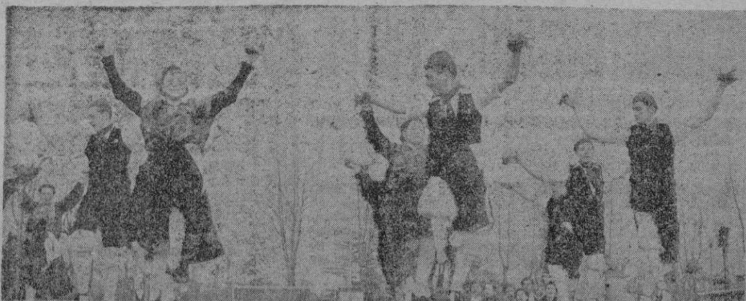
Las danzas, de E. y D., de Zaragoza, en reciente actuación en el festival de Biarritz, que tomarán parte en el II Certamen Internacional de Folklore palmesano