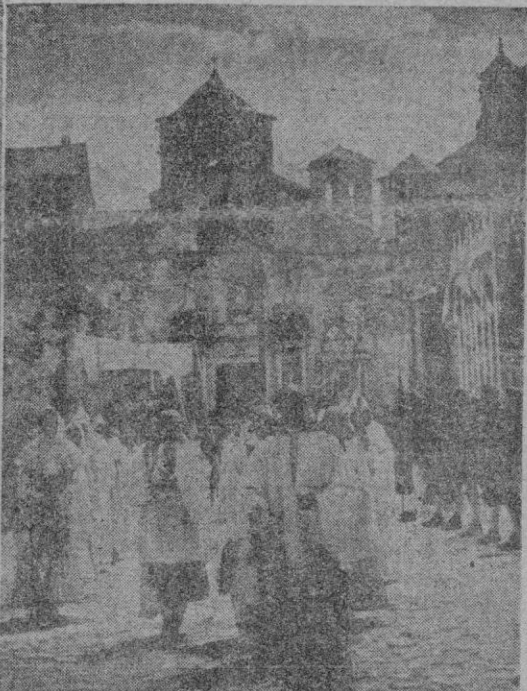
POBLET, DONDE REPOSAN LOS RESTOS DE LOS REYES DE LA CORONA DE ARAGON

Barcelona. — A través de las españolas tierras de Tarragona, en imponente cortejo fúnebre, los restos de los gloriosos reyes de Aragón y Cataluña han vuelto a sus sepulcros del Monasterio de Poblet. A la ceremonia de inhumación asistió S. E. el Jefe del Estado, a quien vemos en las primeras fotos visitando el cenobio cisterciense