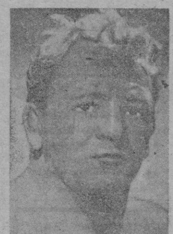
TONY MANN primerísima figura inglesa

En la gran velada internacional de lucha libre del martes