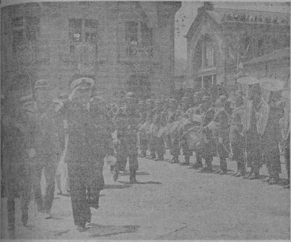
Barcelona. — S. E. el Jefe del Estado pasa revista a las fuerzas que le rindieron honores en el puerto a su llegada a esta ciudad, procedente de Valencia, para asistir al magno Congreso Eucarístico