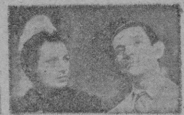
Una escena del film.

"Vive... si te dejan" es película de "cine-club" porque su forma, su técnica, cae completamente en el cine aficionado. Porque en ella no se ha gastado ni una lira más de lo que era necesario, porque ha sido resuelta con una simplicidad de medios absoluta, que no es inconveniente para hacer buen cine. Y "Vive... si te dejan" es película para mayores, porque su tema es humano, sencillo, lleno de sentimiento y comprensión, fina ironía, gracia de la que se encuentra a la vuelta de la esquina.