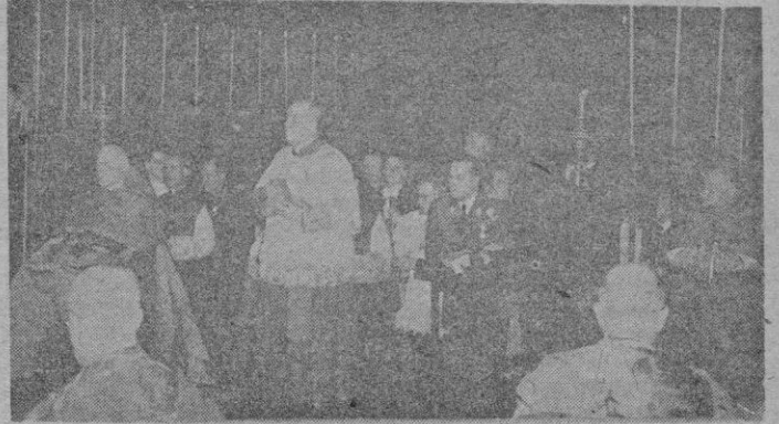
Barcelona. — El Legado de Su Santidad al Congreso Eucarístico Internacional, Cardenal Tedeschini, en la solemne ceremonia celebrada en la Catedral, con la que dió comienzo el magno XXXV Congreso Eucarístico Internacional

formaba la guardia municipal con traje de gala, casaca roja, pantalón azul, casco con penacho de plumas blancas, sable y lanza.