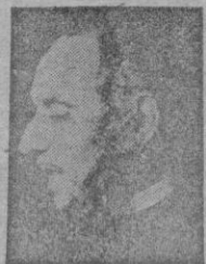
José María Peman

Por JOSE MARIA PEMAN (De la Real Academia Española)