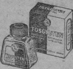
ACIDO GLUTAMICO VITAMINA B. FOSFORO

En la época de su formación intelectual, es cuando los jóvenes precisan los máximos cuidados: Tónicos para estimular las facultades del entendimiento y facilitar el estudio, y reconstituyentes para afenuar el esfuerzo y multiplicar el rendimiento. Dicho técnicamente: Acido glutámico, Fósforo y Vitamina B.