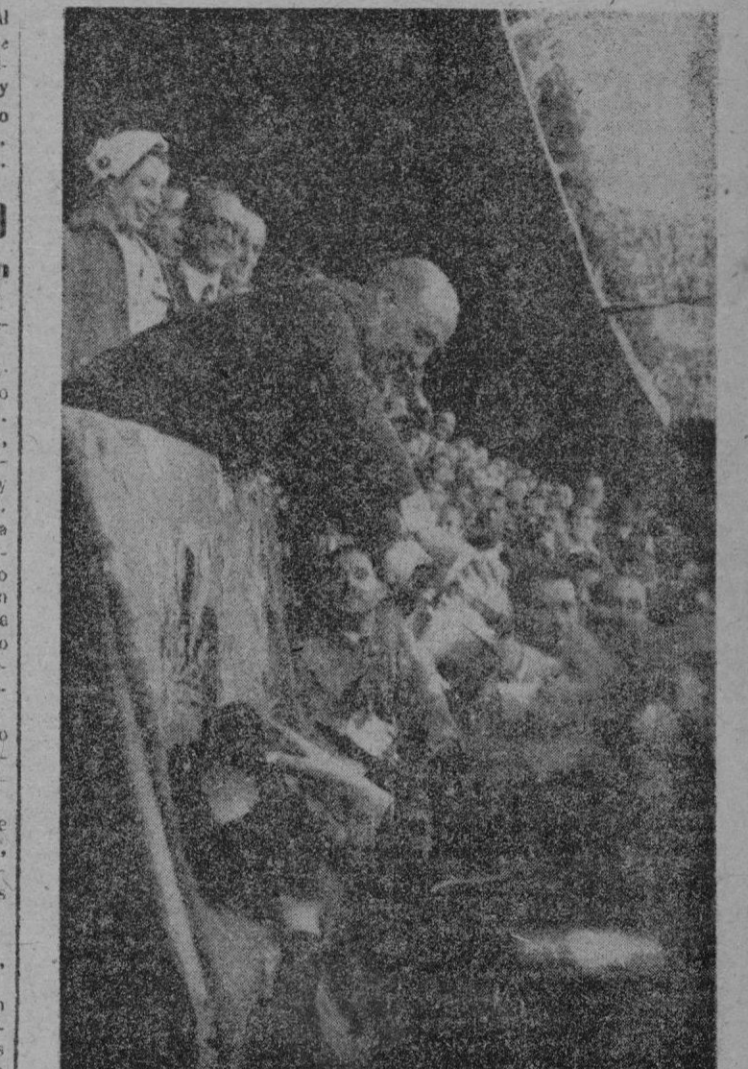
Madrid. — El capitán del "Barcelona", Gonzalvo, recibe de manos de S. E. el Jefe del Estado la Copa conquistada por el equipo catalán al vencer al "Valencia" por 4-2 en el Estadio de Chamartín.