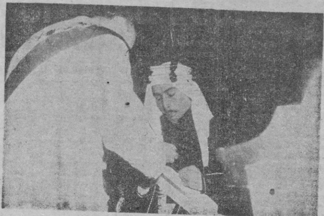
Animan. — El ministro de Asuntos Exteriores señor Martín Artajo, impone al Rey Talal de Jordania, la Gran Cruz del Mérito Militar, concedida por el Gobierno español.