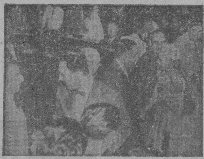
Buenos Aires.—Doña Eva Duarte de Perón acompañada de su esposo es saludada en la Conferencia de los Gobernadores argentinos. Ha sido la primera salida en público de la ilustre dama argentina después de su grave operación quirúrgica en el pasado Noviembre.—(Foto Gifra).