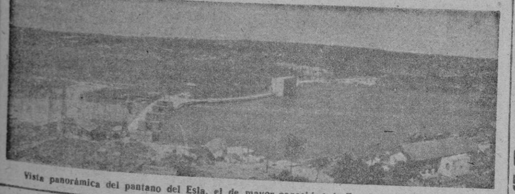
Vista panorámica del pantano del Esla, el de mayor capacidad de España en la actualidad