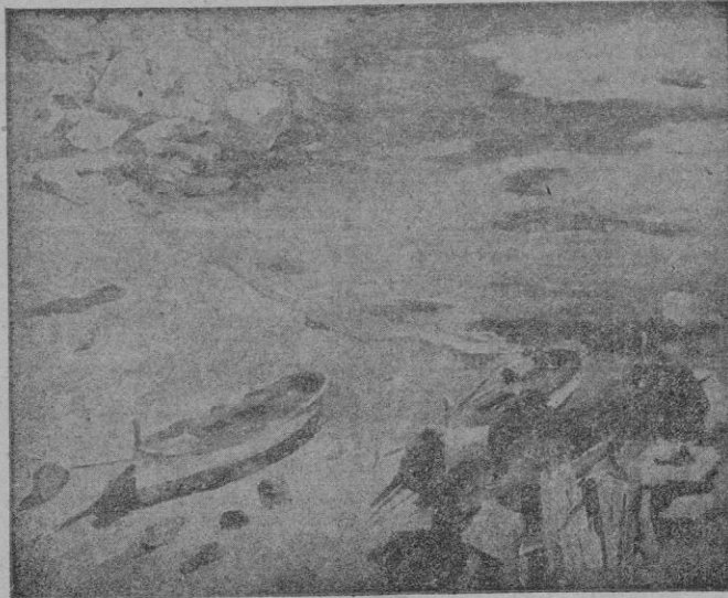
"Barcas", óleo de Pascual Roch Minué.

Roch auna a la perfección sus condiciones de dibujante y colorista, es decir que no colorea sus dibujos, sino que construye a base de color.