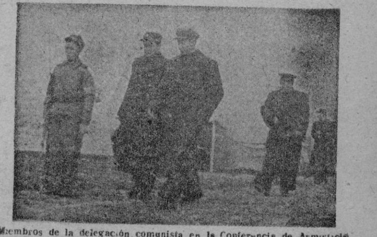
Miembros de la delegación comunista en la Conferencia de Armisticio de Panmunjon, camino del lugar de la reunión.

Bata (Guinea Española) 23. — A las 14 horas tomaron tierra en el aeropuerto de Bata los aviones que conducen al Ministro del Aire y su séquito. En el aeropuerto le esperaban el Gobernador General y autoridades locales, toda la población europea, numerosos indígenas de la localidad y otros muchos que se habían trasladado previamente desde otras comarcas. A continuación el Ministro y autoridades se dirigieron a la iglesia donde fué entonado un Te-Deum. Los alrededores de la iglesia y la avenida que conduce a ella se encontraban materialmente atestados de público. — Cifra.