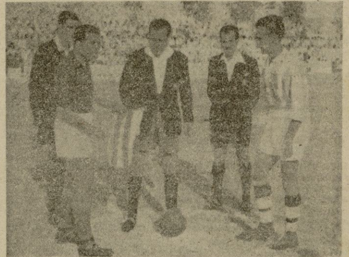
Los capitanes y el arbitro momentos antes de iniciarse el partido

—Vd. ha hecho una crónica como si ya estuviéramos en primera