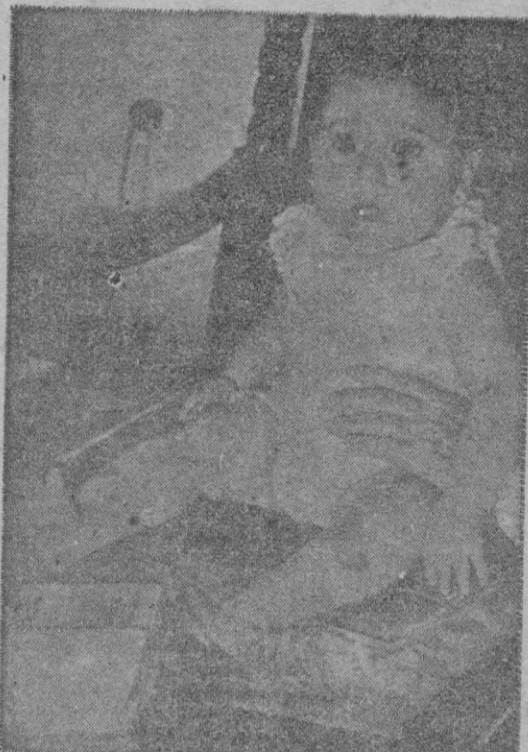
En el Palacio de El Pardo fué fotografiada la nieta de S. E. el Jefe del Estado, hija de los Marqueses de Villaverde. La niña luce su primer traje corto

varios meses entre funcionarios españoles y el Banco de España pertenecerá a la Administración de Cooperación Económica y Comercio Exterior. —(Efe).