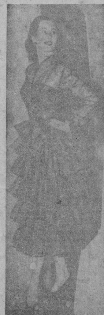
Este vestido con volantes a la andaluza está confeccionado en tul y crinolina; se exhibe en la Exposición de las creaciones italianas y tiene un alegre y frío destino el copetín de cada día