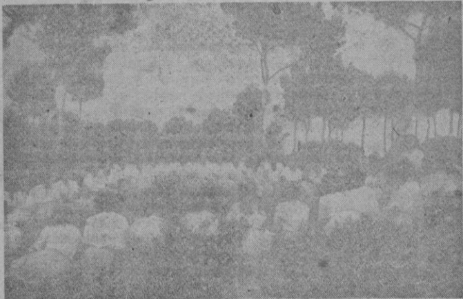
Las maestras del Albergue asisten, en pleno pinar y en un ambiente sano y alegre, a las lecciones que acerca de temas interesantes sobre la mujer y la maestra española les dirige su jefe.

Continúan las actividades formativas de las setenta maestras que procedentes de todas las provincias españolas, incluso de las lejanas Canarias, forman este Albergue Nacional del Servicio Español del Magisterio, en su turno femenino. Según las normas dictadas por el Mandó Nacional y según el horario establecido, desarrollase una vida fecunda en lecciones y prácticas religiosas, en círculos de estudios sobre temas de hacer escolar, en lecciones y demostraciones de enseñanzas específicas de hogar y en charlas informativas sobre la Doctrina del Movimiento, no sólo como perfeccionamiento propio, sino también con fines de una exacta aplicación en nuestras Escuelas. Desde las oraciones de la mañana, izar banderas y consigna, hasta arriar banderas y oración por los Caídos, ante la Cruz a ellos dedicada, desarrollase una jornada activa en la que no faltan, además del aspecto informativo y forma-