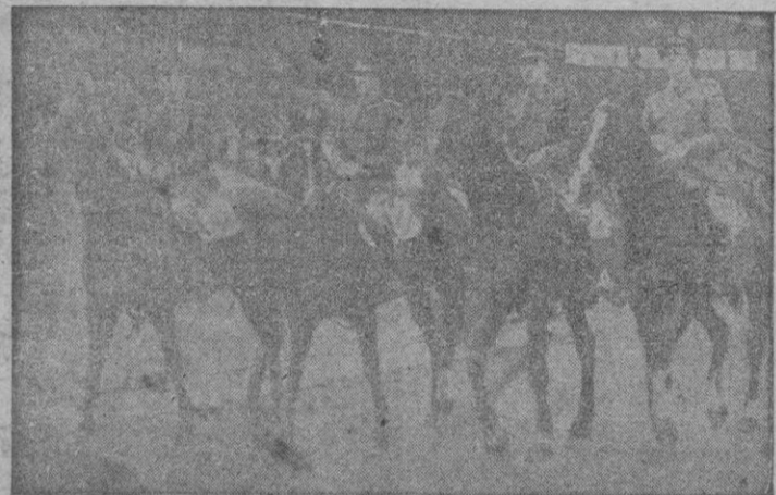
En el torneo hípico recientemente celebrado en Londres tomó parte un excelente equipo español, que aquí aparece durante el desfile preliminar.