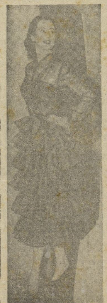
Este vestido con volantes a la andaluza está confeccionado en tul y crinolina; se exhibe en la Exposición de las creaciones italianas y tiene un negro y frío que le destina el copete de caña de