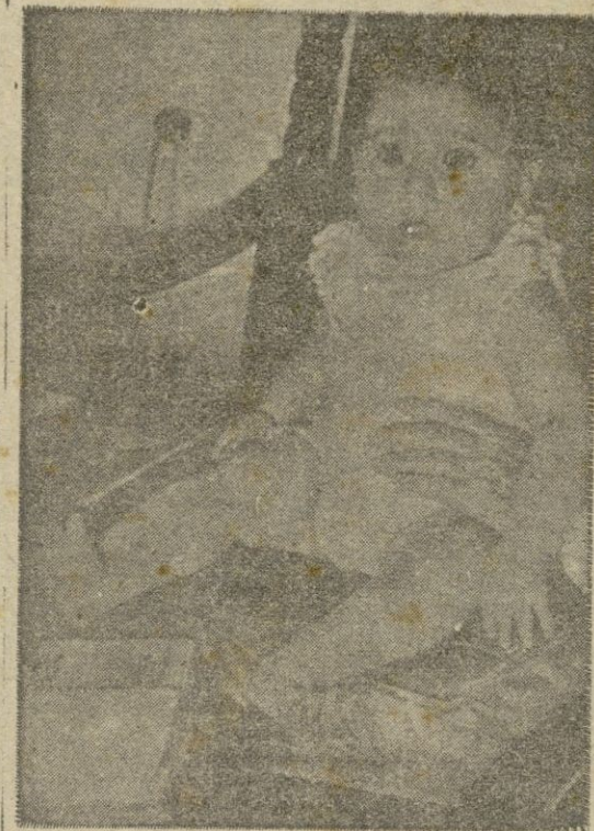
En el Palacio de El Pardo fué fotografiada la nieta de S. E. el Jefe del Estado, hija de los Marqueses de Villaverde. La niña luce su primer traje corto

Varios meses entre funcionarios españoles y el Banco de Exportación e Importación, perteneciente a la Administración de Cooperación Exportación e Importación.—(Efe).