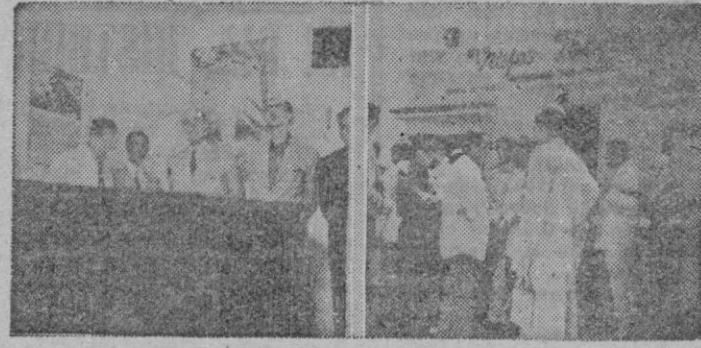
Dos aspectos del acto de inauguración

Visita A la Divina Pastora, en los Capuchinos.