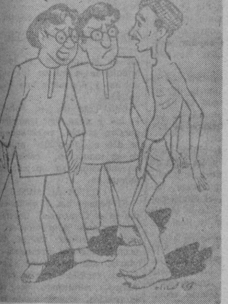
Hay que dar ánimos al "fuerte" para lograr una "victoria proteccionista"

Las nuevas demandas comunistas que piden más sangre aun de la derramada, se producen tras las ejecuciones sumarias y espectaculares de miles de compatriotas, fusilados públicamente después de históricas sesiones de los llamados "tribunales" populares. Las notas oficiales y las informaciones de los periódicos reconocen la existencia y actividad de importantes núcleos adversos muy activos y entusiastas, integrados por partes notables de la población y que no pueden considerarse como simples bandas de desesperados.