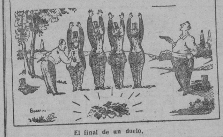
El final de un duelo.