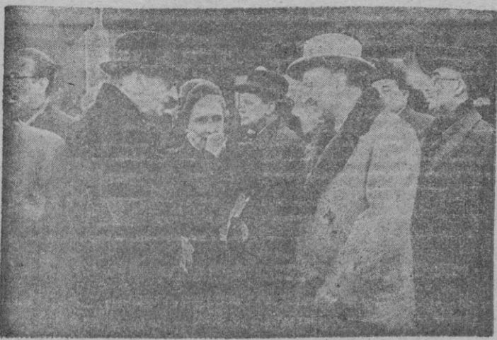
Madrid. — El Ministro de Justicia, señor Fernández Cuesta, acompañado de otros miembros de la Misión española que asistieron a los actos de clausura del Año Santo momentos antes de subir al avión que les condujo a Roma. En el aeropuerto de Barajas se congregaron numerosas personalidades que acudieron a despedir al Ministro y a sus acompañantes.

concentrados en las proximidades de la frontera con Corea unos 300 aviones soviéticos de caza y bombardeo y unos 300 aviones comunistas chinos. Se añade que los rusos han comenzado a preparar un millar de pilotos chinos y a unos mil paracaidistas. Estas informaciones dicen que el Alto Mando establece que en caso de que el conflicto se extendiese, los chinos, los soviéticos y los surcoreanos se pondrían bajo un solo mando que recaería sobre un mariscal soviético. — Efe.