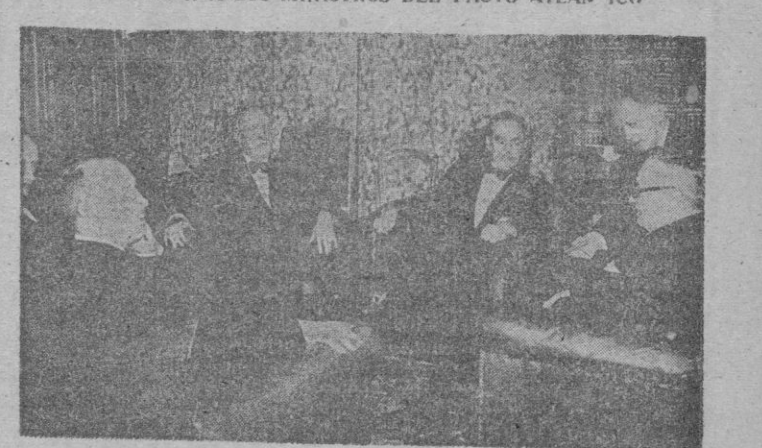
Bruselas. — En la fotografía, de izquierda a derecha: Mr. Robert Schuman, de Francia; Van Zeeland, de Bélgica; Count Sforza, de Italia; Dean Acheson, de EE. UU.; Stikker, de Holanda y Ernest Bevin de Inglaterra, en la recepción que les fué ofrecida a los Ministros participantes en las conversaciones que para la defensa de Europa se han celebrado.