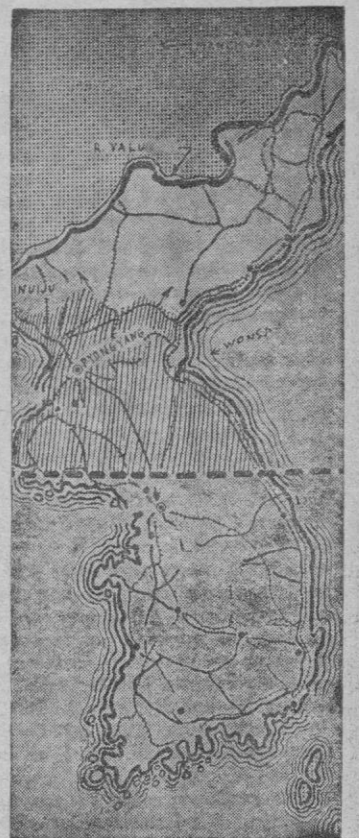
Ahora, hacia el paralelo 38. Sobre la franja más estrecha de la península y aun quizás en la misma línea divisoria de Corea del Norte y Sur volverá a cobrar su fortaleza el hoy en retroceso ejército de las N. U.

Tokio 4. — El comunicado del Cuartel General de Mac Arthur facilitado a las siete de la mañana de hoy, dice: "Hubo poco contacto con el enemigo a lo largo del sector occidental de Corea. En la región Norte y Este de Pyongyang, las fuerzas aliadas consolidaron sus posiciones. Se estiman en 268.000 hombres comunistas chinos los que se oponen ahora a las fuerzas de las Naciones Unidas en el Norte de Corea. Incluye cerca de 400.000 hombres del cuarto ejército especial del Norte de China. Así, un mínimo de 500.000 a 555.000 hombres están disponibles en esta gigantesca concentración, que constituye el segundo escalón de apoyo.