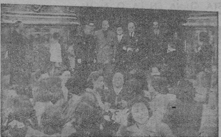
Autoridades y Jerarquías, a la salida del acto religioso.

Con gran solemnidad se ha celebrado nuevamente la fiesta de San José de Calasanz, Patrono del Servicio Español del Magisterio. Los actos comenzaron el primer