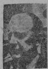
Fernández Cuesta Castillo.

Madrid 27.—Con motivo de la festividad de San José de Calasanz, esta tarde en la Secretaría General del Movimiento, el Secretario Nacional de F. E. T. y de las JONS, camarada Raimundo Fernández Cuesta, impuso las condecoraciones otorgadas a varios camaradas del S. E. M. de Madrid.