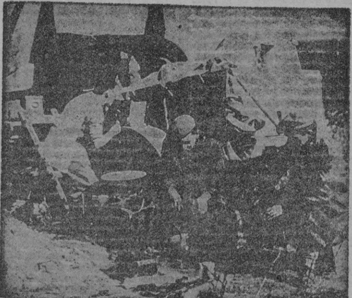
En un lugar del frente. — La fotografía da una idea exacta de como los rigores del invierno dan comienzo en los frentes de Corea. Estos soldados americanos, colocados junto al fuego, parecen pensar en el lejano hogar mientras tienden sus manos al calor de las brasas para mitigar un poco el frío en un descanso de la lucha contra el Ejército norcoreano.

La información no señala con precisión el lugar por donde está efectuándose la penetración, pero